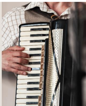
Kaikille avoin ja maksuton